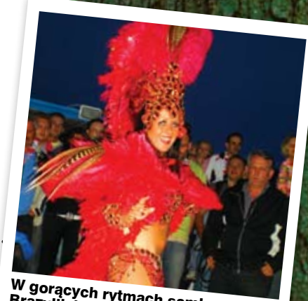
W gorących rytmach samby – Statek Brazylijski na Jeziorze Necko