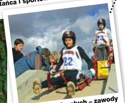
Tylko dla zuchwałych – zawody w jeździe na sankorolkach