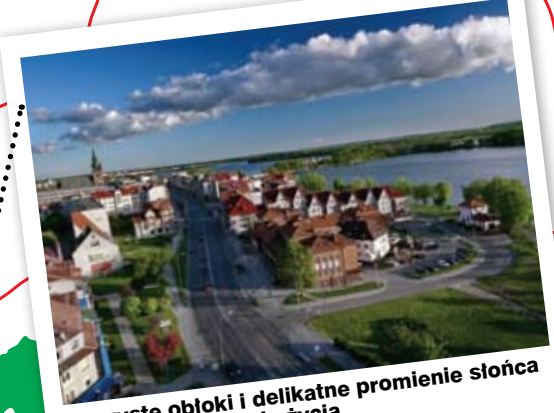
Puszyste obłoki i delikatne promienie słońca – to Elk budzi się do życia