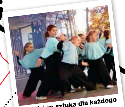
Prawdziwa sztuka dla każdego