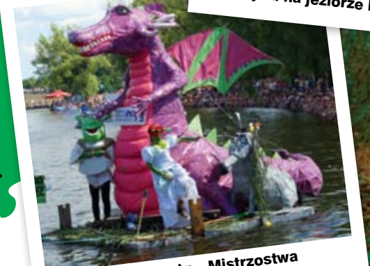
Śhrek, smoki, czołg – Mistrzostwa Świata w Pływaniu na Byle Czym