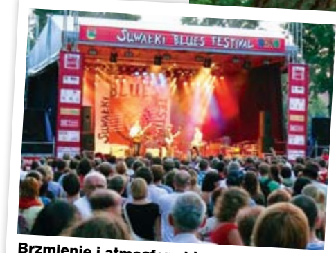
Brzmienie i atmosfera bluesa sprzyjają pogodnemu obliczu Suwałk