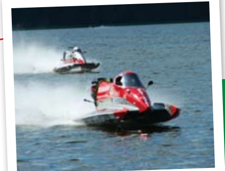
Dzika prędkość i słodka woda – Motorowodne Mistrzostwa Świata