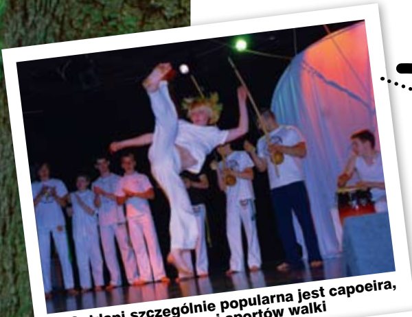
W Góldapi szczególnie popularna jest capoeira, czyli połączenie tańca i sportów walki