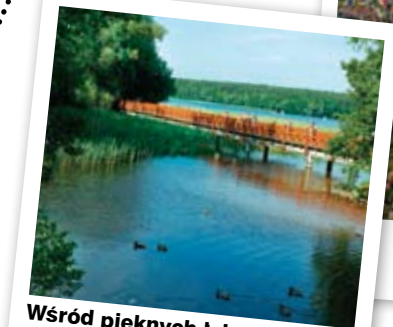
Wśród pięknych łabędzi – jedno z wielu oleckich jezior