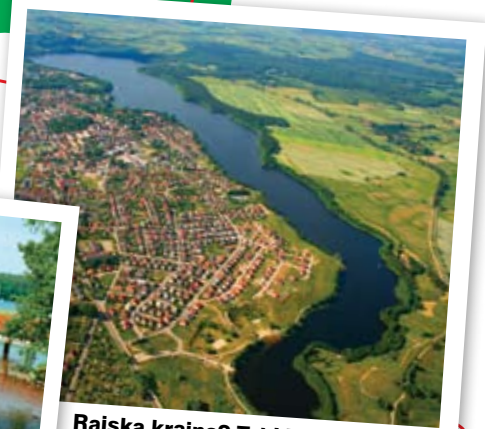
Rajska kraina? Tak! To Olecko z lotu ptaka