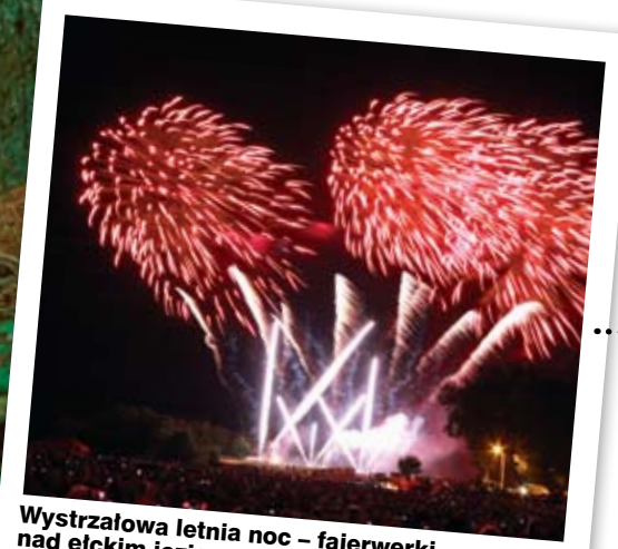
Wystrzałowa letnia noc – fajerwerki nad elckim jeziorem